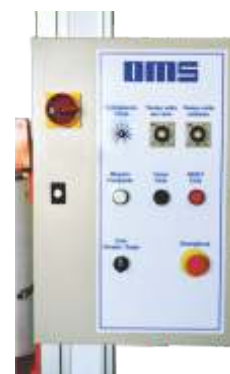
Painel eletromecânico com tensionador de filme stretch