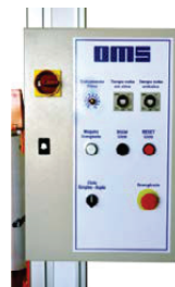
Painel eletromecânico com tensionador de filme stretch