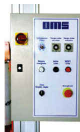
Painel eletromecânico com tensionador de filme stretch